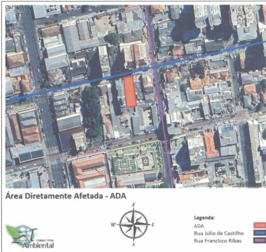
Imagem 19: Área Diretamente Afetada pelo empreendimento.