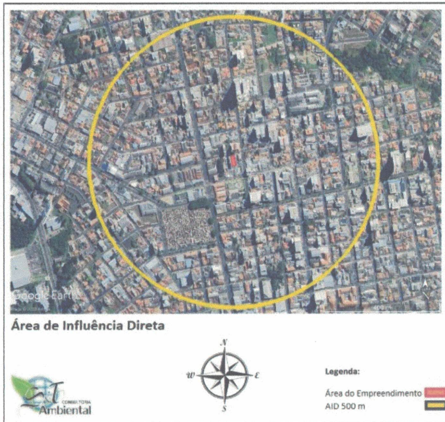
Imagem 20: Área de Influência Direta do empreendimento.