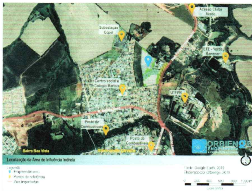
Figura 16: Área de Influência Indireta.