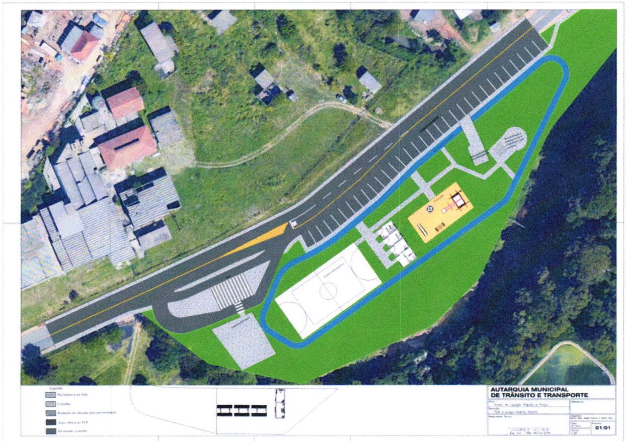
Figura 3: Anteprojeto do PLR.