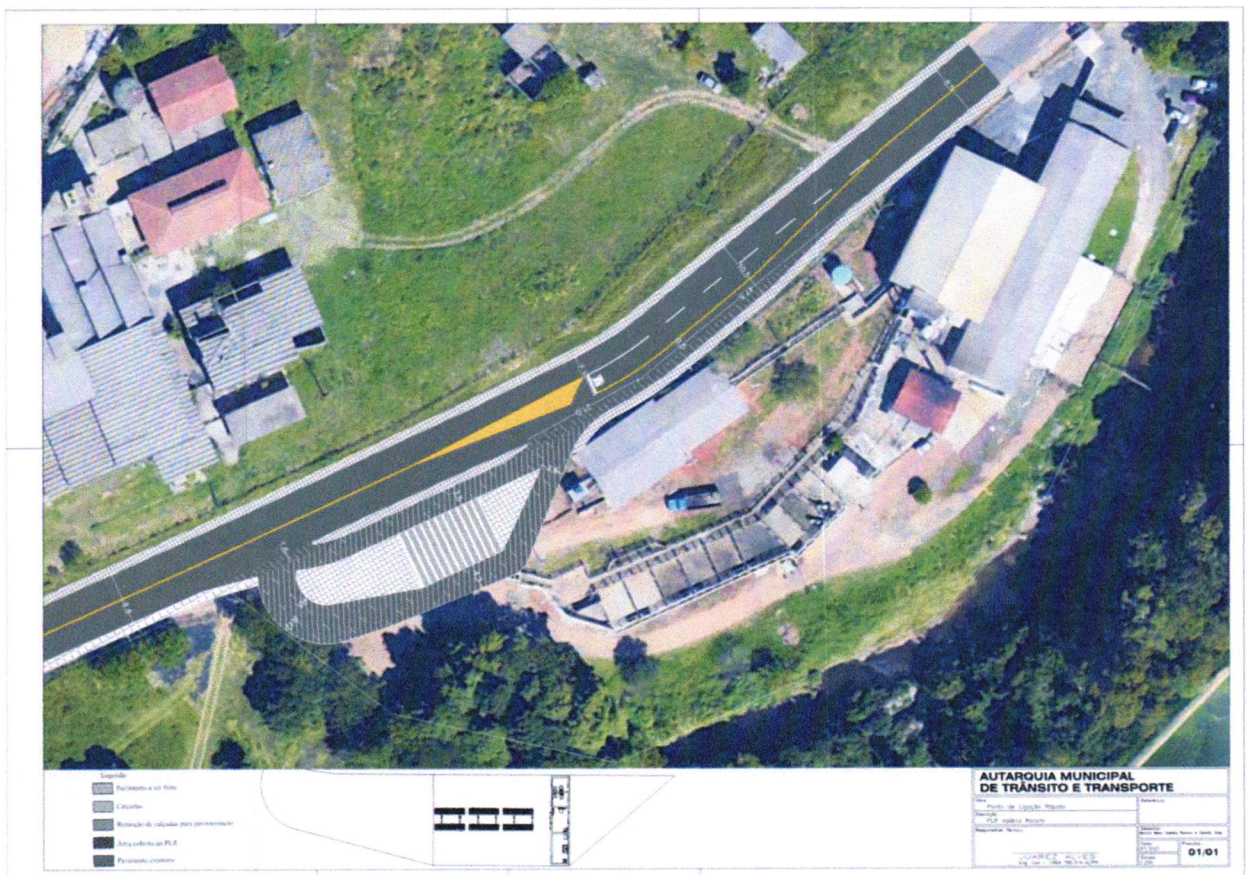
Figura 2: Anteprojeto do PLR.

Esta medida irá proporcionar a viabilidade na questão do transporte coletivo, dando economia com viagens mais curtas para região do bairro Neves, e diminuindo a superlotação no decorrer da rota.